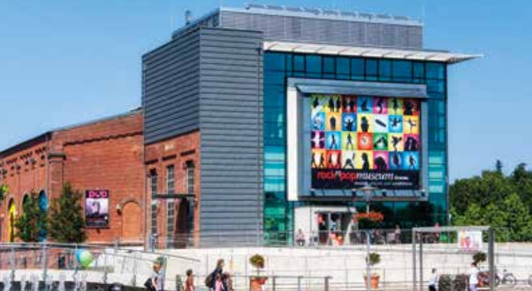
Rock und Pop Museum

Dabei werden Sie feststellen, dass Bus- und Bahnfahren in den letzten Jahren deutlich an Qualität gewonnen hat und viel einfacher geworden ist. Sind Sie 60 Jahre oder älter bieten Ihnen die Verkehrsunternehmen im Münsterland ein einfaches Ticket-Angebot, das genau auf Ihre Bedürfnisse zugeschnitten ist. Ganz gleich ob Sie nur gelegentlich fahren oder täglich, es gibt für jeden Weg ein passendes Ticket.