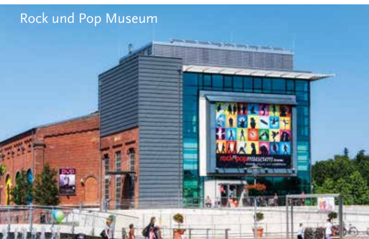
Rock und Pop Museum